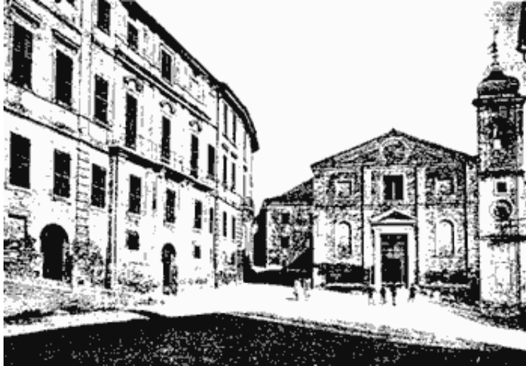
Recanati, Piazzola Sabato del Villaggio

I fanciulli gridando su la piazzuola in frotta, e qua e là saltando, fanno un lieto romore.