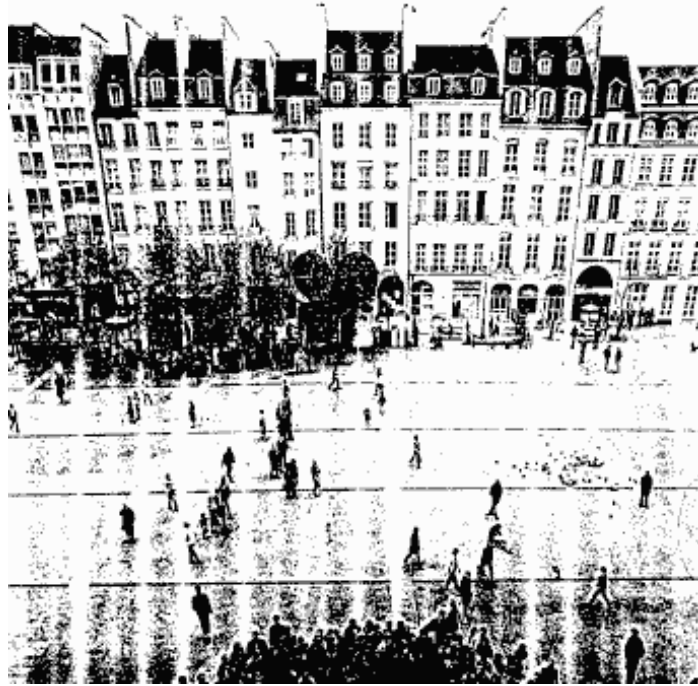
PIANO e ROGERS, centro culturale George Pompidou Parigi, 1971 - 1977